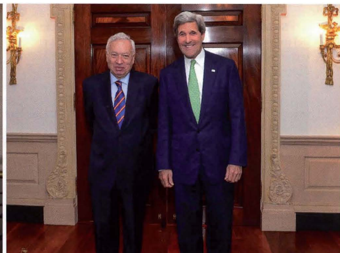
José Manuel García-Margallo y el secretario de Estado de EE.UU. John Kerry.

convirtiese en un territorio exento y ajeno a la legalidad internacional y abierto al terrorismo. Participamos con apoyo logístico en la operación SERVAL, liderada por Francia, y en estos momentos formamos parte de la misión de la Unión Europea dedicada al entrenamiento de las fuerzas de Malí a las que corresponderá asegurar la estabilidad del país. Estamos abiertos también a colaborar en ese proceso de reconciliación nacional que tenga en cuenta los intereses de todos los sectores de Malí, los intereses de todas poblaciones del Sur y del Norte, y que termine en unas elecciones, en una institucionalización que permita a todos sus habitantes mantener la integridad del país y participar de manera importante en el Gobierno que salga de la futura nación.