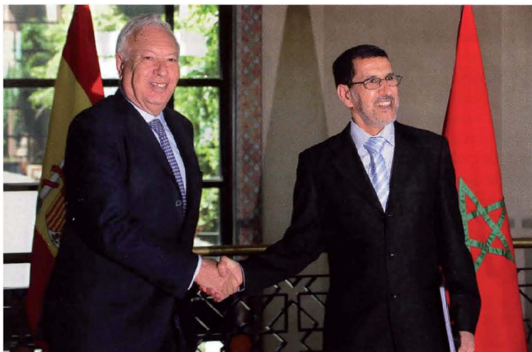
José Manuel García-Margallo y Saad-Eddine El Othmani AAEE de Marruecos.