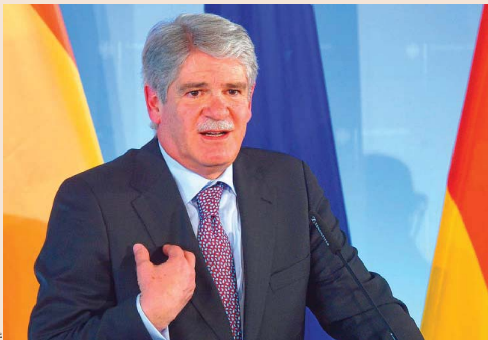
El ministro de Asuntos Exteriores, Alfonso Dastis .

Nuestras relaciones con América Latina son, han sido y estoy convencido de que serán también en el futuro, profundas y polifacéticas. La privilegiada relación política que mantenemos con la mayor parte de los países ha venido acompañada de una intensificación de los vínculos económicos. España mantiene en la región un stock de 143.206 millones de euros, lo que representa el 31,4% de la inversión agregada de España en el mundo. Inversamente, el stock de América Latina en España es de 46.928 millones de euros, el 12,3% del stock de inversión extranjera en España. Por lo que respecta a los flujos comerciales, en 2016 las exportaciones españolas a América Latina fueron de 13.535 millones de euros.