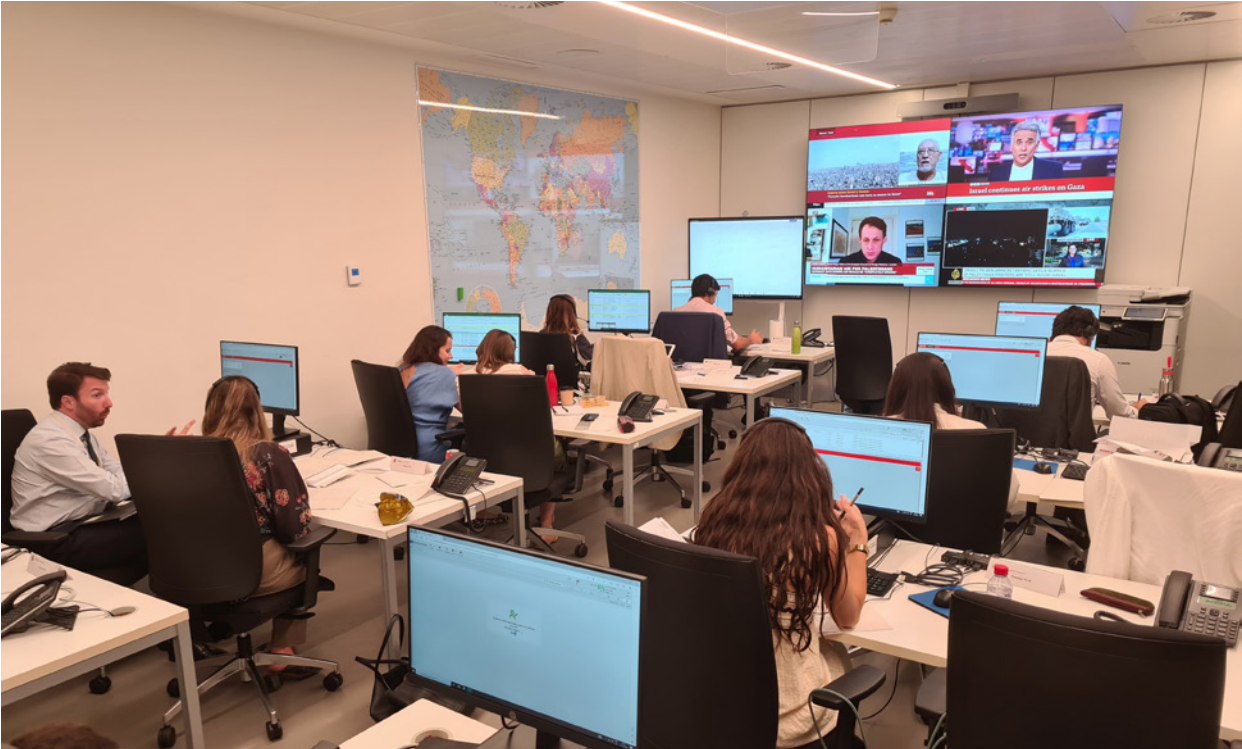
Sala de Crisis del Ministerio de Asuntos Exteriores, Unión Europea y Cooperación durante una emergencia en octubre de 2023.

9.530 salvoconductos. El número de emergencias atendidas en 2023 aumentó en más de un 20 por ciento en comparación con el año anterior, mientras que las llamadas recibidas aumentaron casi un 18 por ciento.