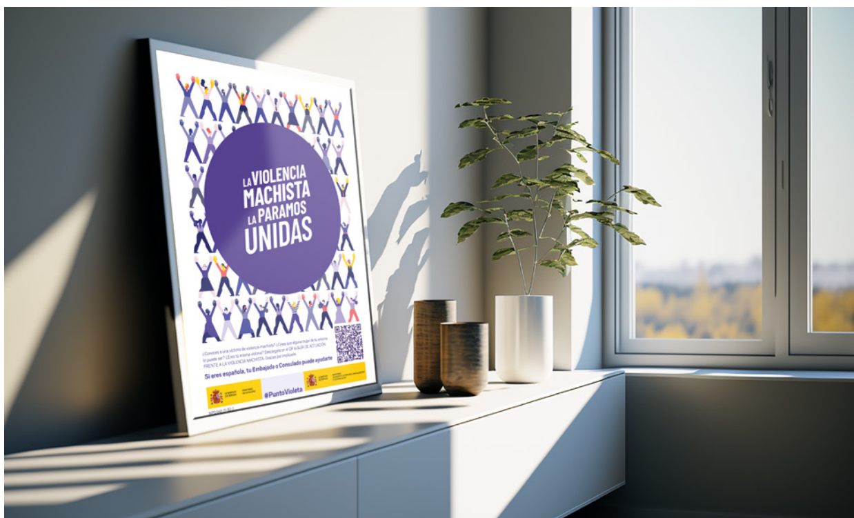
Campaña #PuntoVioleta en las Embajadas y Consulados de España.