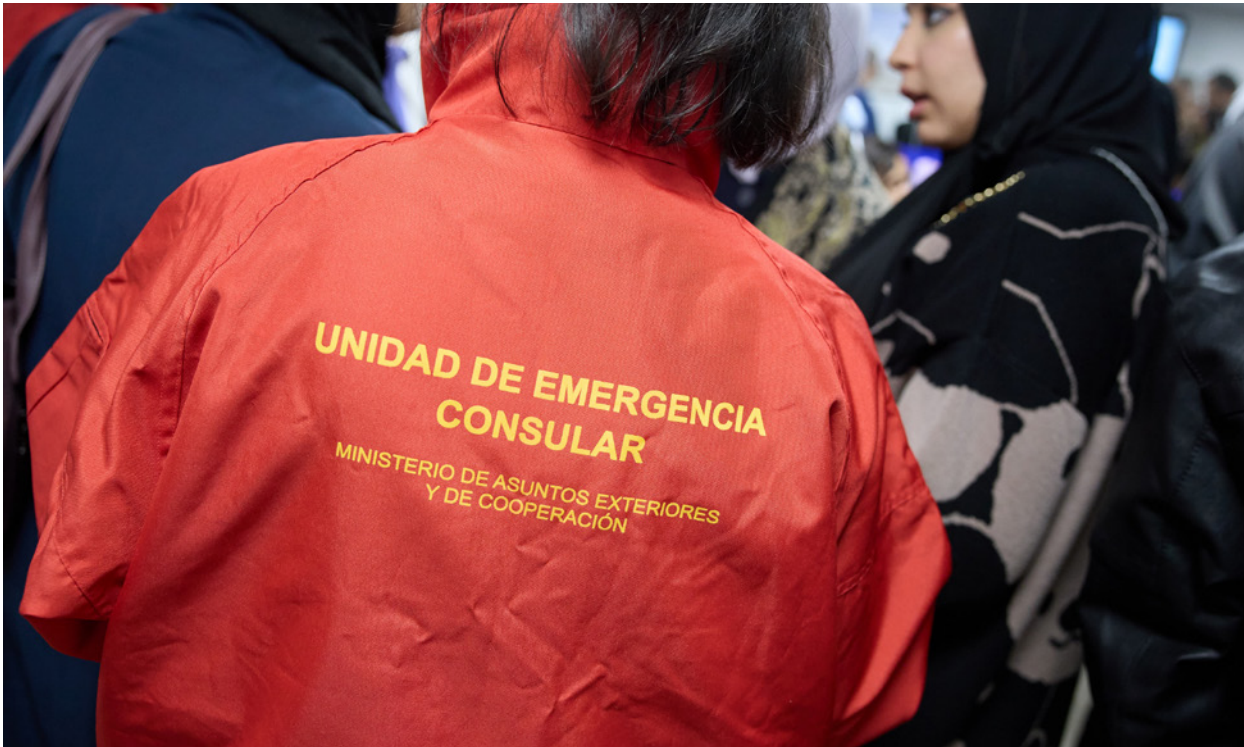
Personal de la División de Emergencia Consular durante una operación de evacuación en 2023.

familiares de los anteriores. El primer y más numeroso grupo de evacuados fue trasladado a España el 16 de noviembre en un avión del Ejército del Aire y del Espacio. El Ministerio de Inclusión, Seguridad Social y Migraciones se encargó de realizar las coordinaciones para la acogida en nuestro país de aquellas personas que no contaban con medios propios o familiares o allegados que pudieran alojarlos de forma temporal.