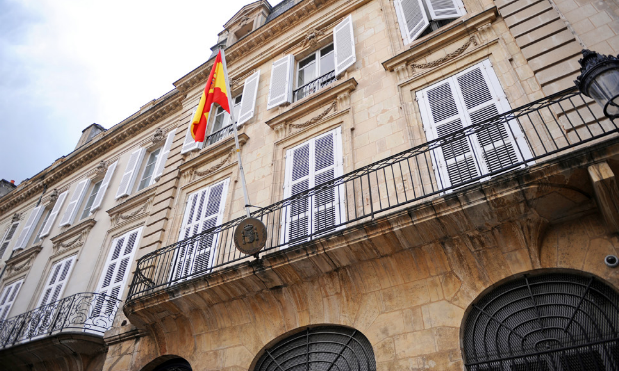
Consulado General de España en Burdeos (Francia).

requisitos para los visados y autorizaciones de residencia a los que se refiere esta ley fueron publicadas el 30 de marzo de 2023.