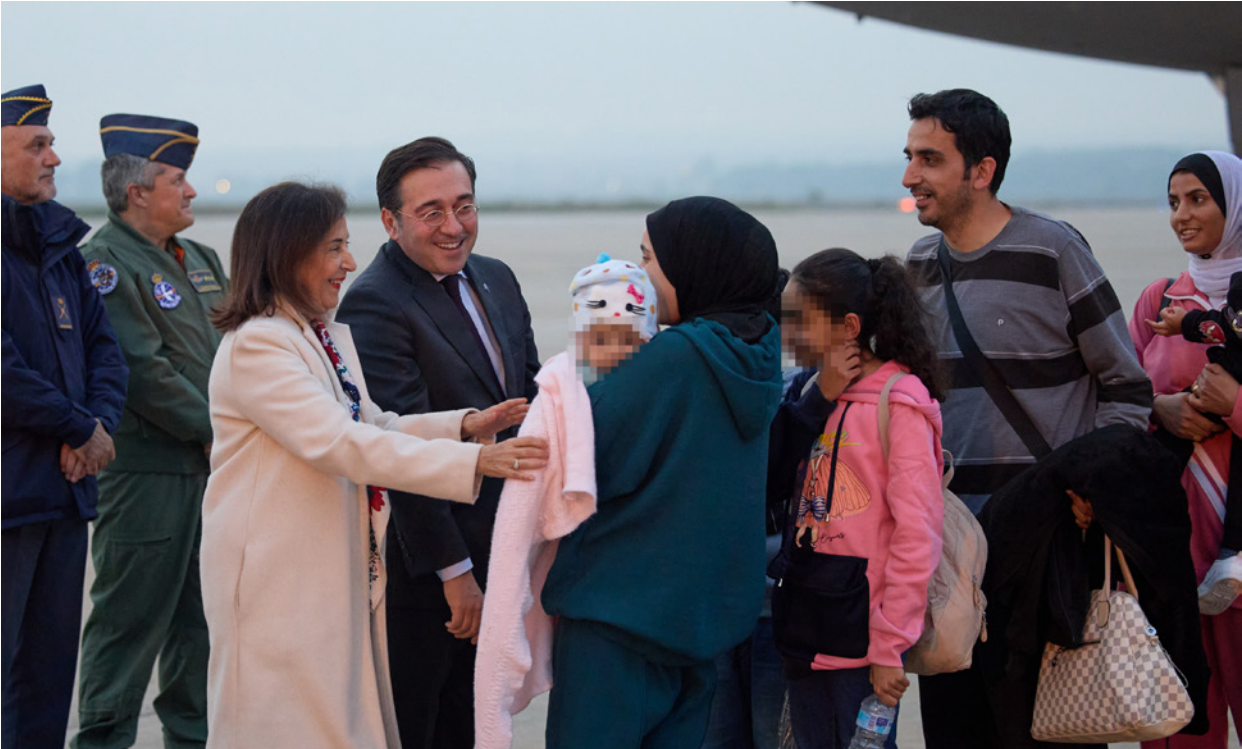
El ministro de Asuntos Exteriores, Unión Europea y Cooperación, junto a la ministra de Defensa, durante el operativo de evacuación de ciudadanos hispano-palestinos a su llegada a la Base Aérea de Torrejón el 16 de noviembre de 2023.

los españoles que se encontraban de visita en Marruecos y que tenían dificultades para encontrar opciones comerciales para regresar a nuestro país.