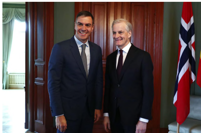
El presidente del Gobierno, Pedro Sánchez, junto al primer ministro del Reino de Noruega, Jonas Gahr Støre. Oslo (Noruega) 12.4.2024.

Primer ministro: Jonas Gahr Støre (Partido Laborista). Ministro de Asuntos Exteriores: Espen Barth Eide (Partido Laborista). Ministra de Cooperación al Desarrollo Internacional: Anne Beathe Tvinneim (Partido de Centro). Ministro de Finanzas: Trygve Slagsvold Vedum (Partido de Centro). Ministro de Defensa: Bjørn Arild Gram (Partido de Centro). Ministra de Justicia e Interior: Emilie Mehl (Partido de Centro). Ministra de Industria y Comercio: Cecilie Myrseth (Partido Laborista). Ministro de Sanidad: Jan Christian Vestre (Partido Laborista). Ministra de Cultura e Igualdad: Lubna Jaffery (Partido Laborista). Ministra de Trabajo y Asuntos Sociales: Tonje Brenna (Partido Laborista). Ministro de Transporte: Jon-Ivar Nygård (Partido Laborista). Ministra de Pesca y Asuntos Marítimos: Marianne Sivertsen Næss (Partido Laborista).