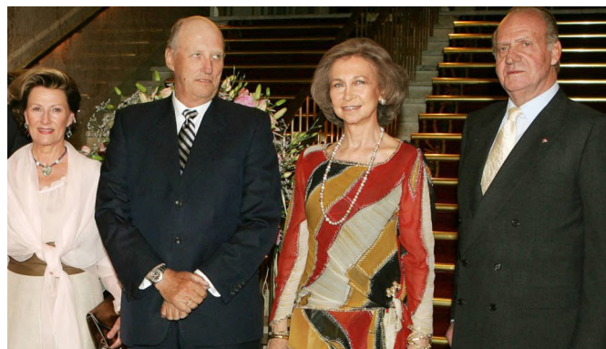
Visita a Oslo de SSMM Don Juan Carlos y Doña Sofía con motivo del 80º aniversario de los reyes de Noruega Harald y Sonia. Oslo, 10 de mayo de 2017