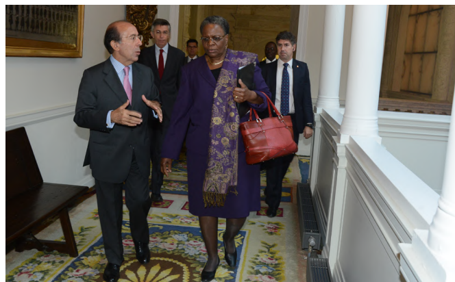
El entonces secretario de Estado de Asuntos Exteriores, Gonzalo de Benito, junto a la anterior ministra de Asuntos Exteriores de Namibia, Netumbo Nandi-Ndaitwah, durante su visita a Madrid en octubre de 2013.