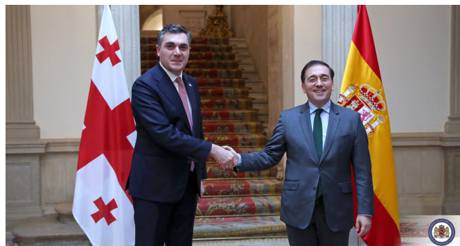
El Ministro de Asuntos Exteriores, Ilia Darchiashvili, se re ne con el Ministro de Asuntos Exteriores espa ol, Jos  Manuel Albares, en Madrid.26/11/2022

Tras las protestas antirrusas en Tiflis en junio de 2019 la relaci n entre Rusia y Georgia empeor  notablemente. Rusia cancel  los vuelos directos a Georgia, dura medida econ mica, y amenaz  con hacer lo mismo con las exportaciones georgianas de vino y agua con gas. La aparici n de tensiones a lo largo de los a os 2020 y 2021 en los territorios de Osetia del Sur y Abjasia, donde Rusia goza de enorme influencia y presencia, tambi n debe interpretarse desde esta  ptica. Los  nicos foros de negociaci n entre Georgia y