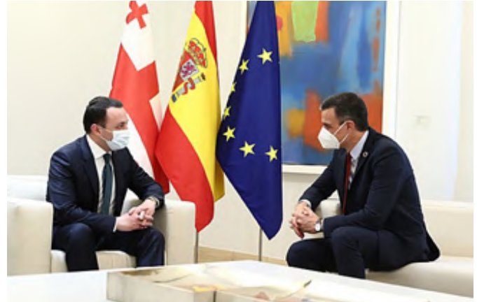
Reunión del presidente del Gobierno español, Pedro Sánchez, y el primer ministro de Georgia, Irakli Garibashvili.-La Moncloa, Madrid - Viernes 21 de mayo de 2021.-foto: Pool Moncloa/Jorge Villar