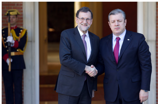
El anterior presidente del Gobierno, Mariano Rajoy, recibe en el Palacio de la Moncloa al entonces primer ministro de Georgia, Giorgi Kvirikashvili. 18/01/2017

Salomé Zourabishvili, presidenta . Irakli Kobakhidze, primer ministro .