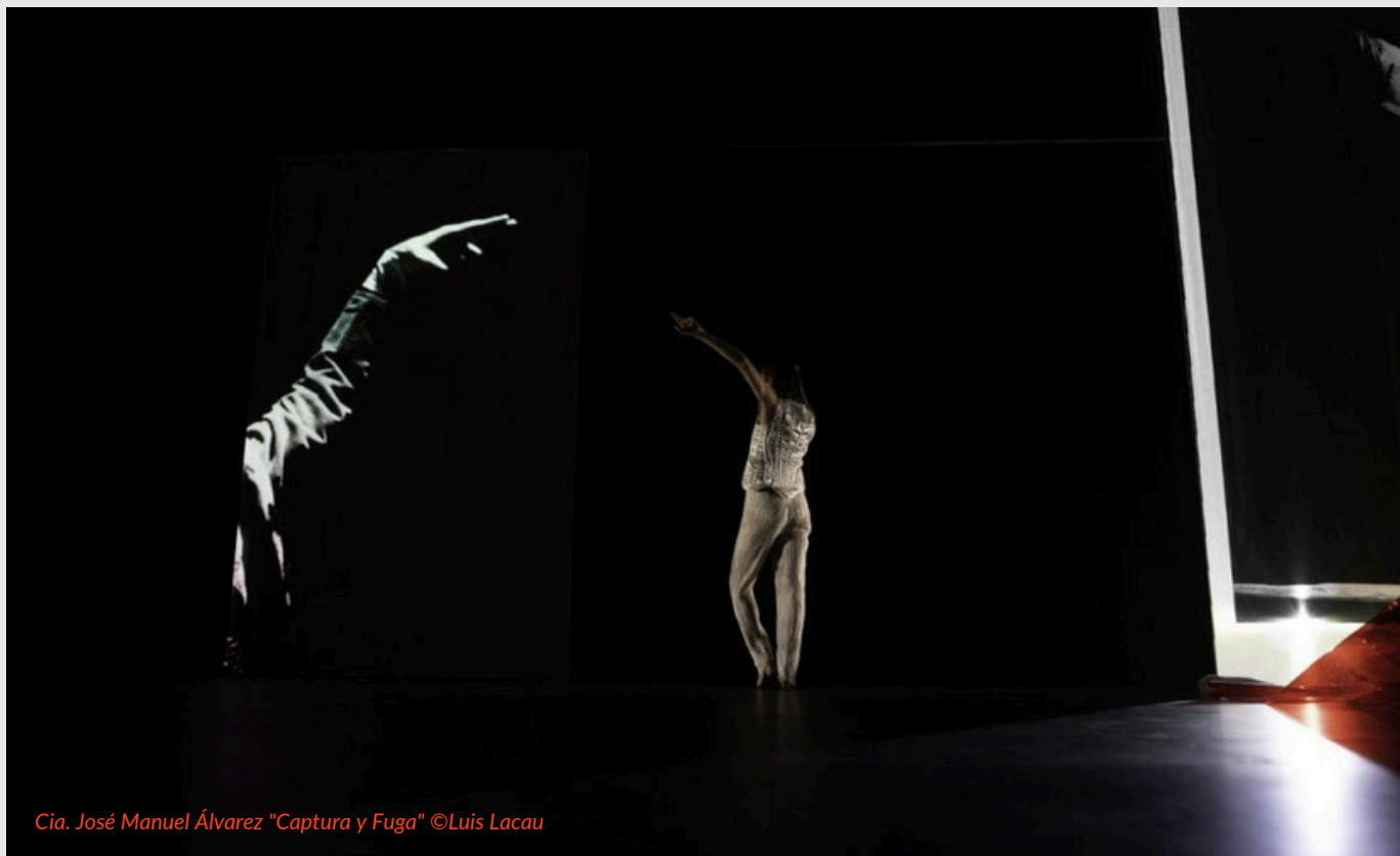
Cia. José Manuel Álvarez "Captura y Fuga"