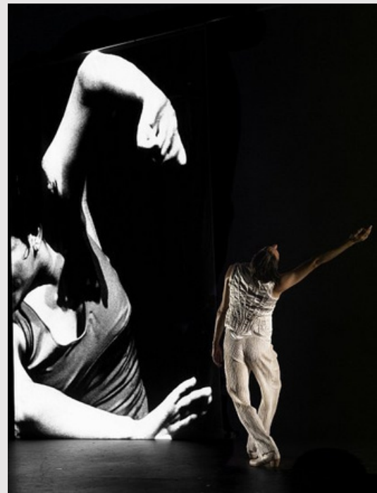
Cia. José Manuel Álvarez "Captura y Fuga"