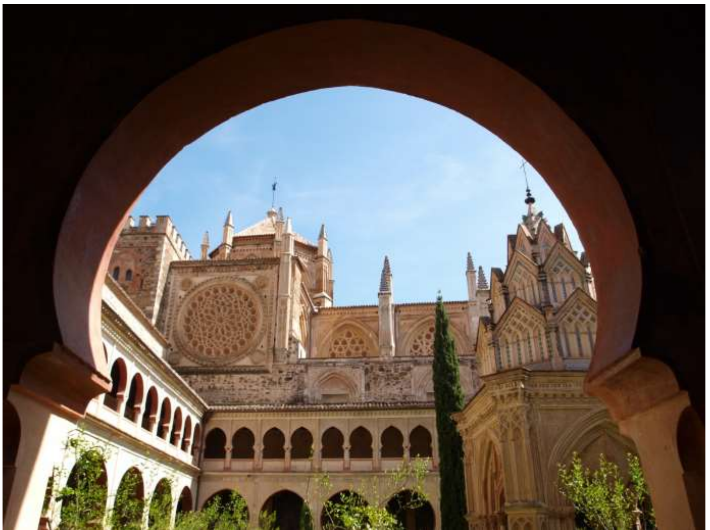
Real Monasterio de Santa María de Guadalupe, Cáceres

DE LA EMBAJADA DE ESPAÑA EN SUIZA Y LIECHTENSTEIN