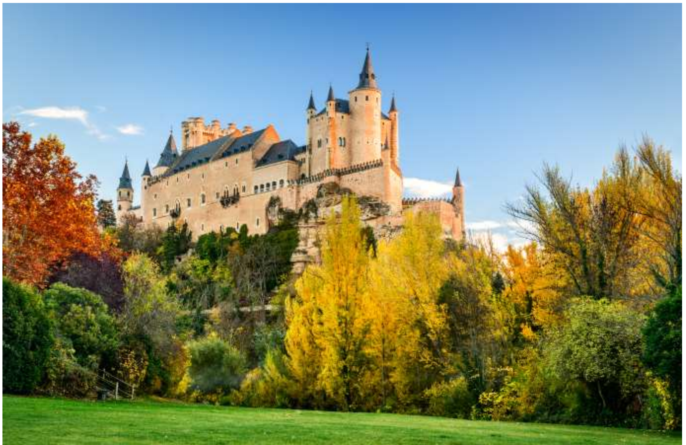
Alcázar de Segovia, Segovia

DE LA EMBAJADA DE ESPAÑA EN SUIZA Y LIECHTENSTEIN