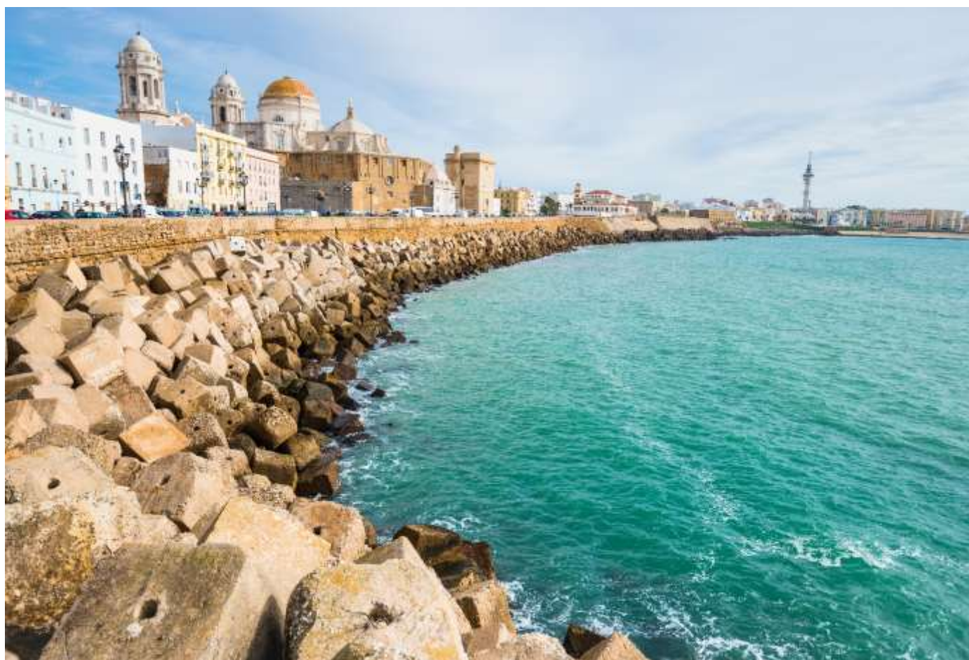
Paseo marítimo de Cádiz, Cádiz

DE LA EMBAJADA DE ESPAÑA EN SUIZA Y LIECHTENSTEIN