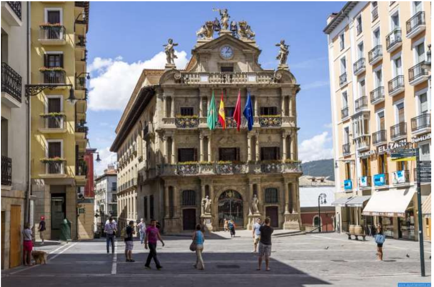
Ayuntamiento de Pamplona, Navarra

DE LA EMBAJADA DE ESPAÑA EN SUIZA Y LIECHTENSTEIN