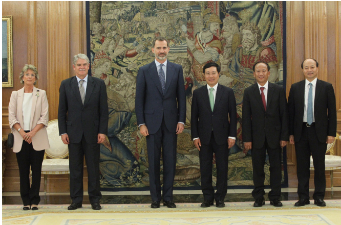
Su Majestad el Rey con el vice primer ministro y el entonces ministro de Asuntos Exteriores de la República Socialista de Vietnam, Pham Binh Minh, y las delegaciones de ambos países.- Palacio de La Zarzuela. Madrid, 23.05.2017.

EE UU es el principal destino de las exportaciones vietnamitas. Vietnam, junto al resto de países del TPP, se sumó al CPTPP, firmado en marzo de 2018 sin contar con EEUU.