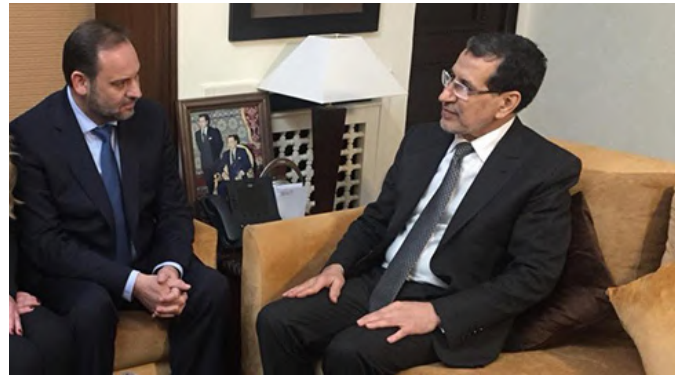
Encuentro en Rabat entre el jefe del Gobierno Marroquí, Saad-Eddine El Othmani y el anterior ministro de Fomento, José Luis Ábalos, Rabat, enero 2019.

En la actualidad se están estudiando nuevos proyectos en el marco de la cooperación delegada, que se llevarían a cabo en los sectores y regiones prioritarias para la cooperación española.