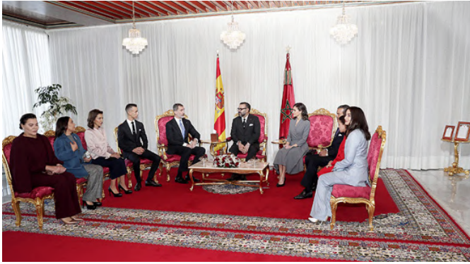
Miembros de la familia real marroquí con los Reyes de España en su visita de Estado a Marruecos.- Febrero 2019.- @ Fernando Junco