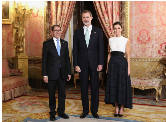
Sus Majestades los Reyes junto al Excmo. Sr. Saadeddine Othmani, jefe del Gobierno de Marruecos, durante la recepción ofrecida por SS MM a los jefes de Estado, de Gobierno y de Delegaciones asistentes a la COP25.- Palacio Real de Madrid, 02/12/2019.

Es destacable que, en Marruecos, el instrumento de financiación de Convenios ONGD, que ofrece una estabilidad de fondos y de colaboración con la AECID a medio plazo, está siendo relevante para buscar el máximo de complementariedad entre esa vía y la cooperación bilateral con subvenciones directas. En la última Convocatoria de Convenios 2022-2024 se han seleccionado el proyecto "InnoVERT: Desarrollo de ecosistemas de emprendimiento verde para jóvenes, mujeres y migrantes en Tánger, Tetuán y Mdiq-Fnideq