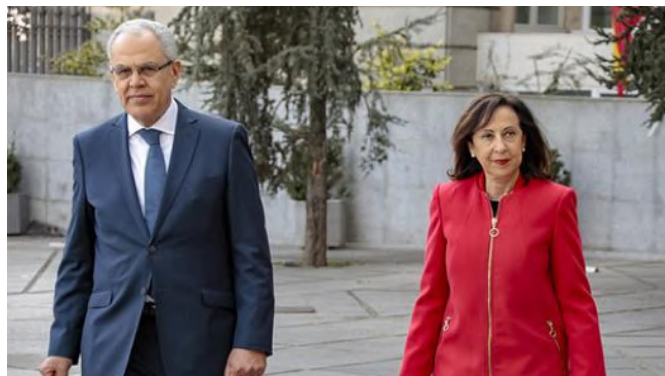
La ministra de Defensa, Margarita Robles, mantuvo un encuentro con el ministro delegado ante el jefe de Gobierno del Reino de Marruecos, encargado de la Defensa Nacional, Abdelatif Loudyi.- Madrid , 4 de marzo de 2019.