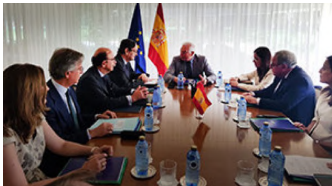
Reunión mantenida entre el anterior ministro de Asuntos Exteriores, Unión Europea y Cooperación, Josep Borrell en Rabat con los cónsules generales de España en Marruecos.- Junio 2019.- © Grupo Crónicas de la Emigración.

Se reactivará la cooperación sectorial en todos los ámbitos de interés común: económico, comercial, energético, industrial y cultural, entre otros.