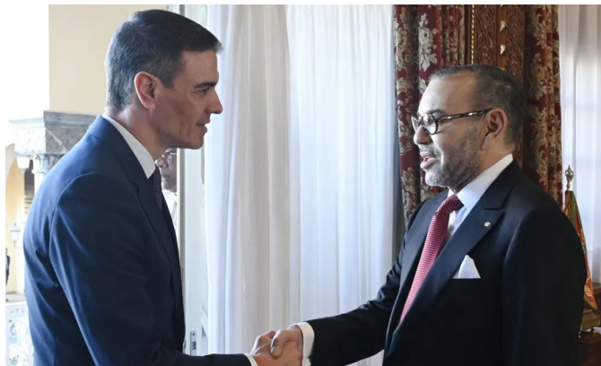
El presidente del Gobierno español, Pedro Sánchez, junto al rey Mohamed VI.-Rabat 21/02/2024.-foto: FE/Pool Moncloa/Borja Puig de la Bellacasa