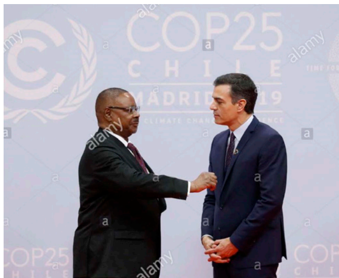
Encuentro entre el presidente de Gobierno en funciones, Pedro Sánchez y el anterior presidente de Malawi, Peter Mutharika a su llegada a la ceremonia de apertura de la Cumbre del Clima COP25 celebrada en Madrid el 2 de diciembre de 2019.- EFE / Alamy Live News Madrid

En septiembre de 2014, España y Malawi firmaron un MOU (Memorandum of Understanding) en materia de Cooperación, con la intención de colaborar conjuntamente en caso de desastres naturales, desarrollo de la agricultura, fomento de las energías renovables, la seguridad alimenticia y un turismo