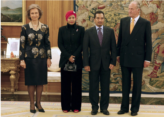
SS MM los reyes de España, junto a SS MM los reyes de Malasia, durante la visita oficial que realizaron a España, en octubre de 2008.