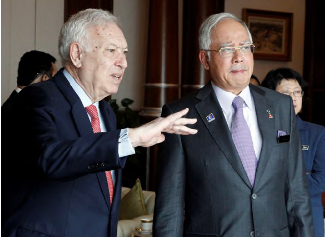
El anterior ministro de AA.EE y de Cooperación José Manuel García-Margallo, junto al entonces primer ministro de Malasia, Najib Razak, durante su visita a Kuala Lumpur en marzo de 2014.

la compra de laboratorios españoles y la construcción del centro. Ya se han graduado las primeras promociones de estudiantes del MSI.