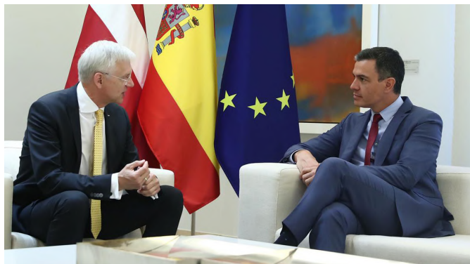
El presidente del Gobierno, Pedro Sánchez, conversa con el primer ministro de la República de Letonia, Arturs Krišjānis Kariņš.-Madrid 13/06/2022.- Foto: Pool Moncloa/ Fernando Calvo.

Letonia es miembro del Consejo de Europa desde 1995, desempeñando la Presidencia de turno en el periodo noviembre 2000-mayo 2001.