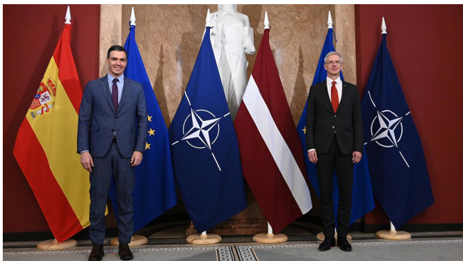
El presidente del Gobierno, Pedro Sánchez se desplazó a Letonia, donde fue recibido por el primer ministro Letón, Arturs Krišjānis Kariņš. Riga (Letonia) 8.3.2022

12/2021: Visita del Ministro de Asuntos Exteriores, con ocasión de la reunión Ministerial OTAN.