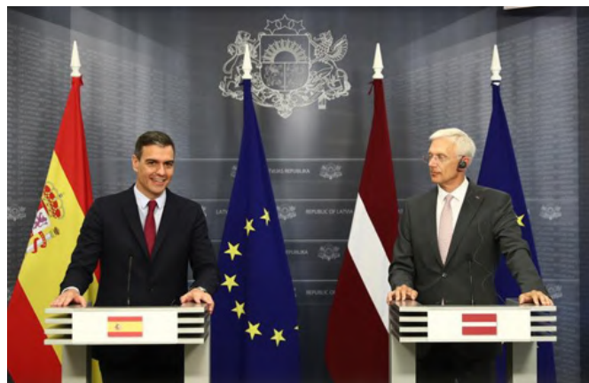
Intervención del presidente del Gobierno, Pedro Sánchez, en comparecencia conjunta con el primer ministro de Letonia, Arturs Krišjānis Kariņš.-Riga (Letonia) - miércoles 7 de julio de 2021.- FICHA PAÍS LETONIA

de adhesión a la OTAN. En 2008 fue nombrado secretario de Estado de Defensa, cargo que ocupó hasta su nombramiento ese mismo año como jefe de la Cancillería del Presidente de la República. Fue ministro de Asuntos Exteriores desde el 25 de octubre de 2011, cargo que renovó con la confianza del Parlamento el 5 de noviembre de 2014. Y el 23 de enero de 2019. El 8 de julio de 2023 tomó posesión de su cargo como presidente de la República de Letonia. Además de letón, habla inglés, ruso y francés.