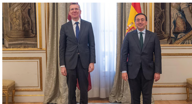
José Manuel Albares recibe a su homólogo Edgars Rinkēvičs en el centenario de las relaciones diplomáticas entre Letonia y España.-Madrid (Palacio de Viana) 26/04/2022.- foto Elena Martín (Nolsom) / MAEUC

La cooperación en el ámbito cultural y educativo es creciente. Varias universidades españolas han firmado convenios con las principales de Letonia y el número de Erasmus españoles ha venido aumentando. La AECID financia dos lectorados en sendas universidades en Riga, gracias a los cuales también se ofrecen clases a funcionarios y empleados letones en colaboración con la Escuela Nacional de Administración. Letonia no es país objeto de Ayuda Oficial al Desarrollo española.