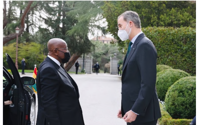
SM el Rey, recibe al presidente de la república de Ghana, Nana Addo Dankwa Akufo-Addo.- Palacio de La Zarzuela.- Madrid, 30.03.2021.