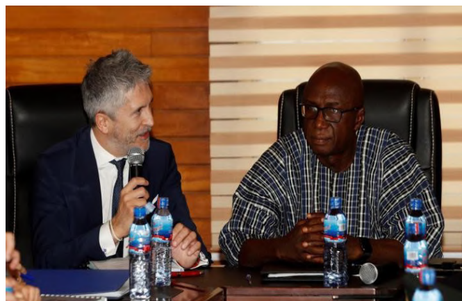
Encuentro entre Grande-Marlaska con su homólogo ghanés, Ambrose Dery. (Foto: Facilitada por el Ministerio del Interior (EFE) Por Maribel Ángel-Moreno).- Ghana, Febrero 2019