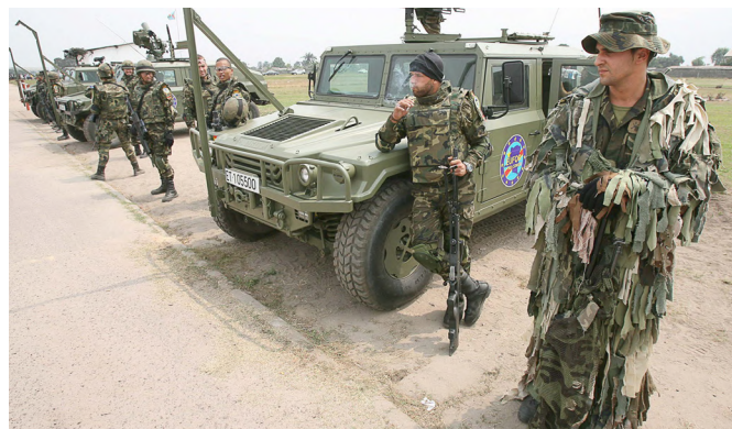
Tropas españolas instaladas en la República Democrática del Congo, en apoyo a la misión de Naciones Unidas, en julio de 2006.