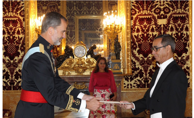
Entrega de cartas credenciales ante S.M el Rey D. Felipe VI del embajador de Cabo Verde en España, Excmo. Sr. Manuel Ney Monteiro Cardoso. 20 de septiembre 2017

Por todo ello, La Unión Europea sigue siendo un socio fundamental para Cabo Verde. El Partenariado Especial ha incrementado el diálogo político de forma notable en el marco de su 10º aniversario celebrado en 2018 y de nuevo en 2023 con motivo del 15º aniversario reforzando la cooperación en tres nuevos pilares: inversión, crecimiento, y empleo; gestión de los océanos y economía azul; y reforma de la Administración Pública, contribuyendo a importantes avances en materia de buen gobierno.