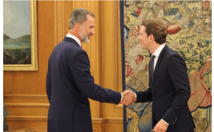
Su Majestad el Rey recibió en audiencia a la anterior canciller Federal de la República de Austria, Sr. Sebastian Kurz, con motivo de su visita a España.- Septiembre 2018.