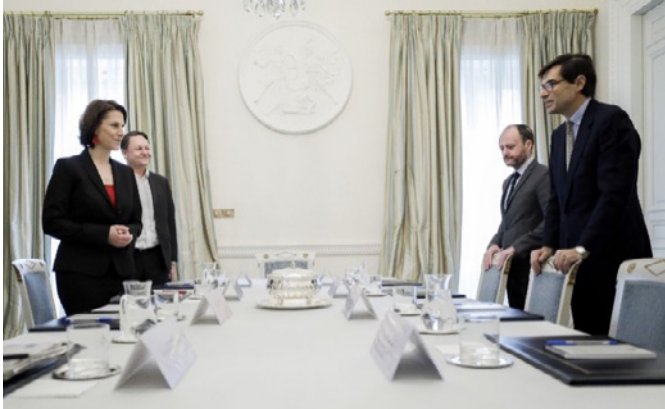
La ministra federal Karoline Edtstadler se reunió con el secretario de Estado de la UE, Juan González-Barba Pera, para una reunión de trabajo como parte de su viaje a Madrid. 14 de febrero de 2020.

Acuerdo entre la República de Austria y el Gobierno del Reino de España sobre las relaciones en el ámbito audiovisual.