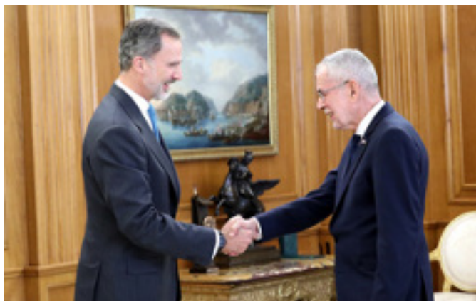
SM El Rey recibe al presidente Federal de la República de Austria, Sr. Alexander Van Der Bellen.- Palacio de La Zarzuela. Madrid, 03.12.2019.

24/27-05-2017 , la presidenta del Parlamento, Doris Bures, consultas bilaterales.