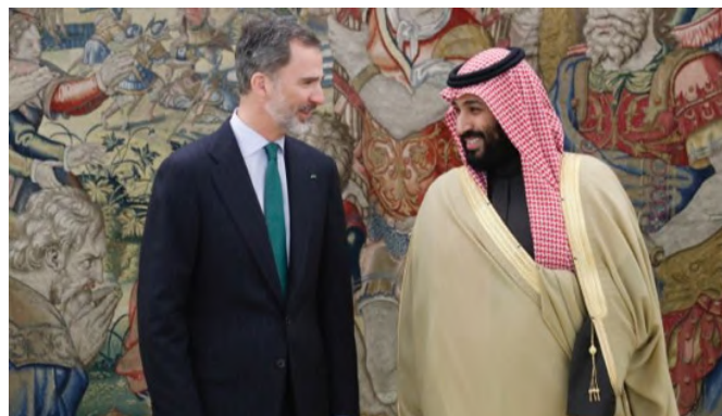
Su Majestad el Rey Felipe VI junto a su Alteza Real el Príncipe Heredero del Reino de Arabia Saudí, Mohammed bin Salman bin Abdulaziz al-Saud. Palacio de la Zarzuela. Madrid, 12.4.2018.

Fue educado EEUU. De 1996 a 1998 fue vicepresidente de la Junta de Directores de la Compañía Saudita de Mantenimiento y Operación, poste-