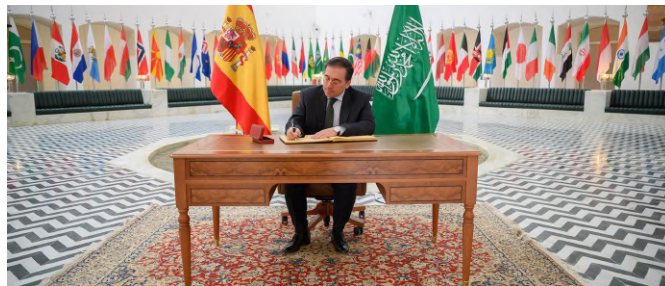
Visita del ministro de AA Exteriores, Unión Europea y Cooperación José Manuel Albares a Riad.-Arabia Saudí 07/02/2024.-foto: MAEUC

El turismo saudí en España ha sido también un vehículo de acercamiento entre ambas sociedades. En la actualidad, 80.000 saudíes viajan a España cada año, muchos tienen residencia en el país, y otros acuden a realizar sus estudios.