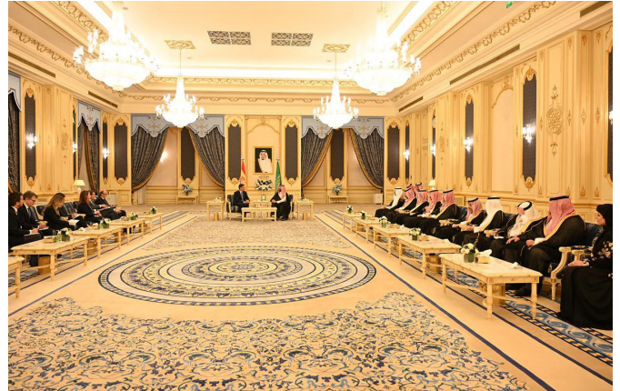
El presidente del gobierno español, Pedro Sánchez, junto al príncipe heredero del Reino de Arabia Saudí, Mohamed bin Salmán.-Arabia Saudí 02/04/2024.-foto:Pool Moncloa/Jorge Villar