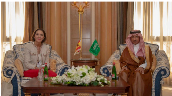
La ministra de Industria, Comercio y Turismo, Reyes Maroto, junto a su homólogo el ministro de Turismo del Reino de Arabia Saudí, Ahmed Al Khateeb en Riad 27 de octubre de 2021.

El proceso y los derechos de los encausados en Arabia Saudí vienen regulados por la Ley de Enjuiciamiento de 2001, si bien los mismos siguen caracterizados por una enorme opacidad.