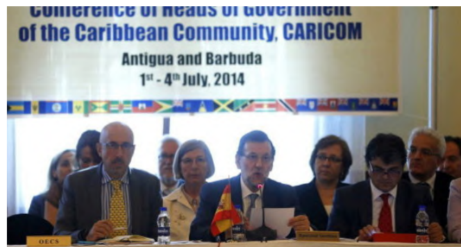
El anterior presidente de Gobierno, D. Mariano Rajoy, en la XXXV Cumbre de jefes de Estado y de Gobierno de la CARICOM, celebrada en Antigua y Barbuda, julio 2014

A lo largo de 2014 se ejecutó diversos proyectos de cooperación en Antigua y Barbuda con financiación de AECID a través del Fondo España-CARICOM.