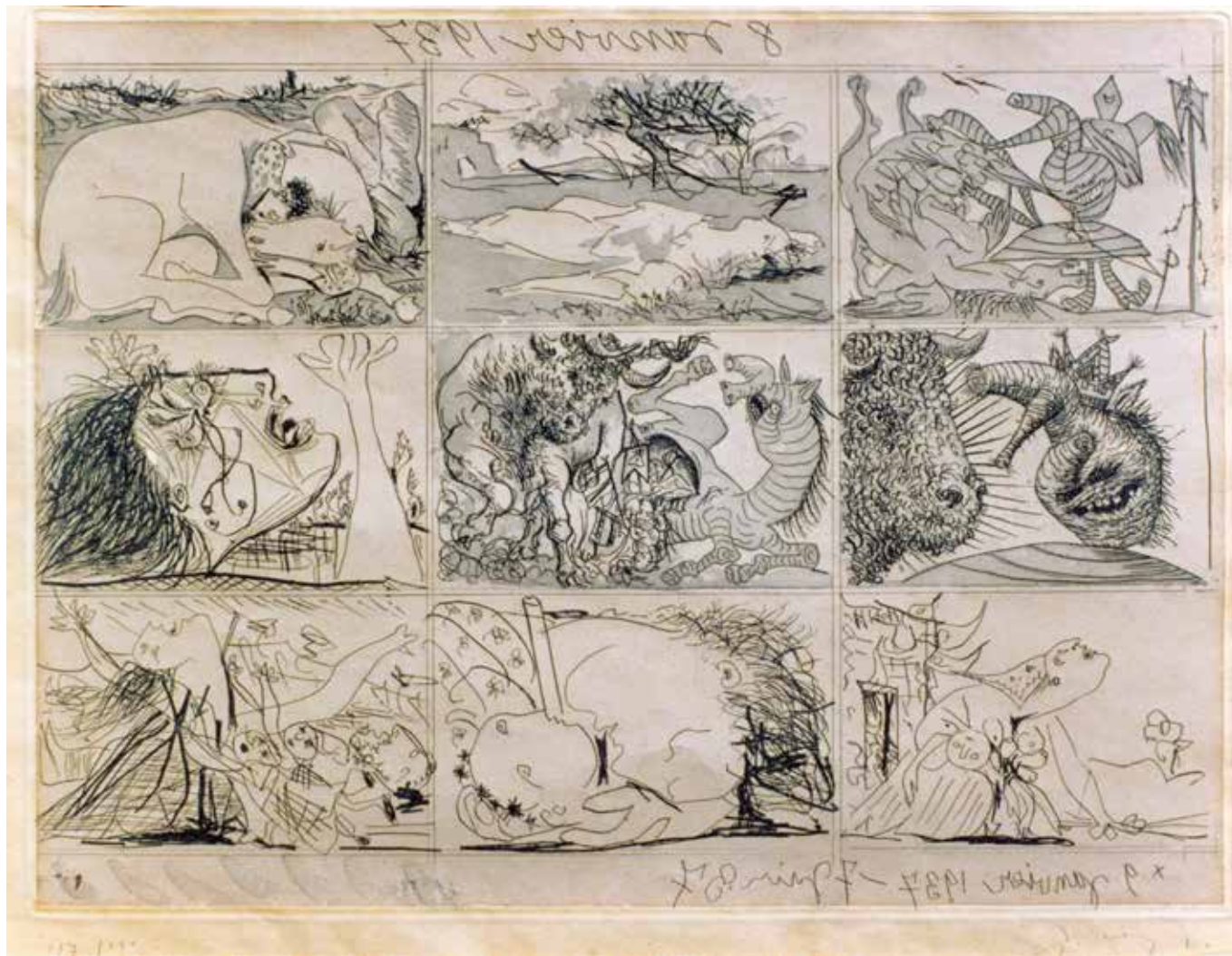
Sueño y mentira de Franco II - 1937 - Aguafuerte y aguatinta - 30,8 x 41,5 cm - Colección MEC