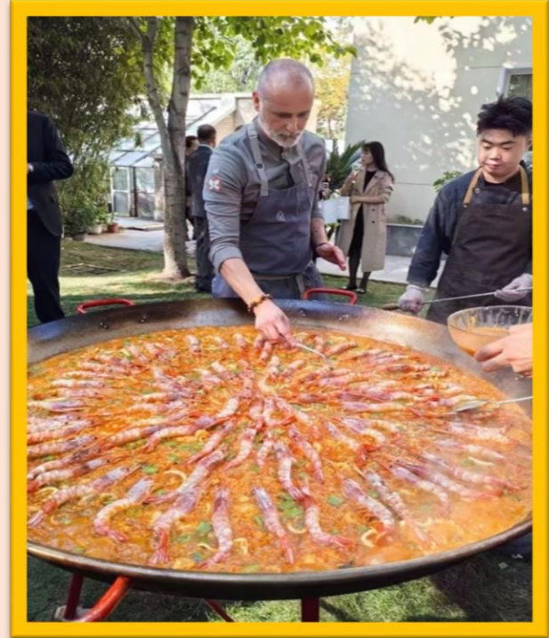
El maestro en comida española Rodrigo de la Calle en acción demostrando sus buenas artes culinarias.