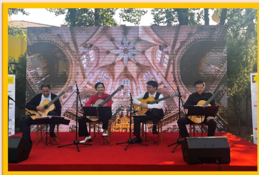
Maestros chinos de guitarra española deleitaron su buen arte interpretando piezas musicales de flamenco.