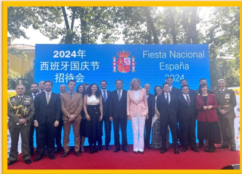
La Embajadora de España en China D a Marta Betanzos Roig y el viceministro del Ministerio de Asuntos Exteriores de la RP China, D. Deng Li posan junto con los altos cargos diplomáticos y consejeros de todas las secciones que conforman la Embajada de España en Pekín.