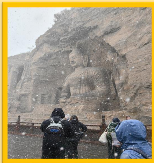
Foto de Yungang Grottoes bajo la nieve en Datong, provincia de Shanxi el pasado martes.

En cuestiones meteorológicas, si vais a viajar a Taiwan, Zhejiang y Fujian, extremad las precauciones debido a los azotes del tifón Krathon, el 18 de este año. En este sentido sabed que el centro nacional de meteorología ha decretado el segundo nivel de máxima alerta. Se espera que ya en territorio continental se debilite y pierda fuerza. En cuanto a temperaturas se refiere, llevad ropa de abrigo si viajáis a provincias del noreste y suroeste de China, ya que las condiciones del tiempo son bastante frías.