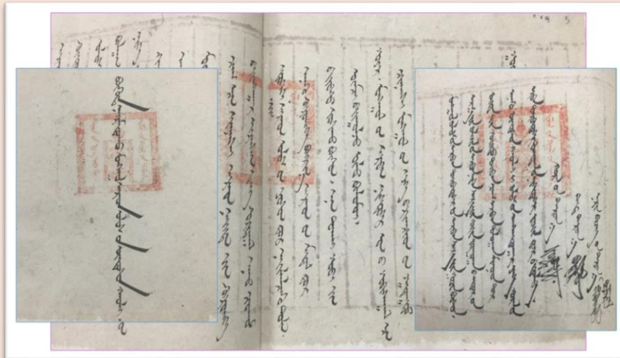
Artículo primero de la Constitución de Mongolia