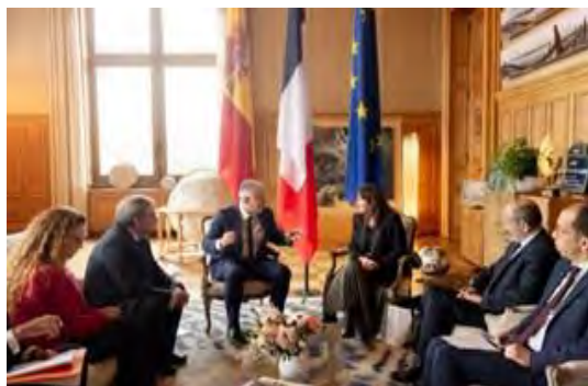
Reunión con la Alcaldesa de Paris Anne Hidalgo, el Ministro de Memoria democrática Angel Victor Torres y el Embajador de España Victorio Redondo

El ministro realizó una ofrenda floral junto a la alcaldesa