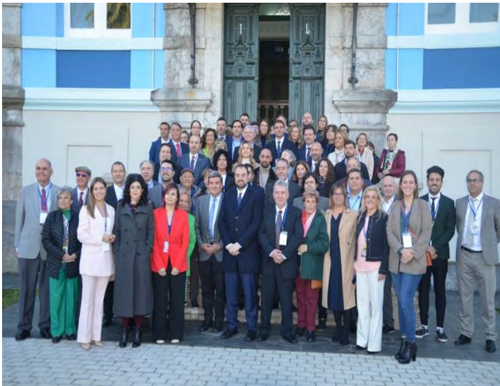
Consejeros del CGCEE en el pleno de Asturias

La inauguración del pleno tuvo lugar el 6 de noviembre en un enclave de gran relevancia para la tradición migratoria asturiana como es el Museo de la Emigración de la Fundación Archivo de Indianos, en Colombres. Violeta Alonso, Presidenta del CGCEE, fue la encargada de dar comienzo a la jornada, seguida del Ministro en funciones de Inclusión, Seguridad Social y Migraciones, José Luis Escrivá Belmonte. El Ministro destacó las aportaciones del CGCEE al borrador del Reglamento de Estatuto de la Ciudadanía Española en el Exterior y resaltó el trabajo de la Oficina del Retorno en la mejora de la asistencia a los españoles que desean regresar a nuestro país. Así, apostó decididamente por avanzar hacia una política de retorno más ambiciosa con la digitalización y simplificación de los procedimientos.