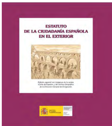
Portada del primer Estatuto de 2006

El objetivo es "unificar en una sola disposición el actual entramado dispar en cuanto a rango, antigüedad y contenido que regula los derechos y deberes de la ciudadanía española en el exterior" pero también tiene como finalidad "adaptar la normativa existente a los cambios producidos durante los últimos años en los ámbitos social, económico, laboral y sanitario a las características y circunstancias de los diferentes colectivos de ciudadanos en el exterior y personas retornadas"