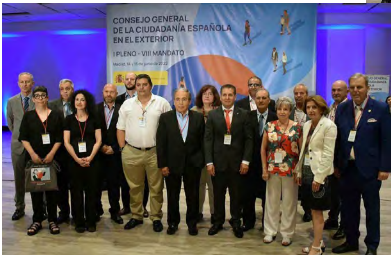
Comisión Socio Laboral