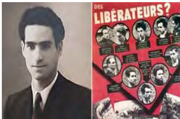
Celestino Alfonso y l'Affiche Rouge

Francia ofreció este miércoles un homenaje tardío al sacrificio de la Resistencia extranjera a la ocupación nazi con la entrada en el Panteón de Missak Manuchian, líder de un grupo de comunistas nacidos fuera de Francia y ejecutados hace 80 años. Los