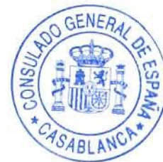
Luis Belzuz de los Ríos