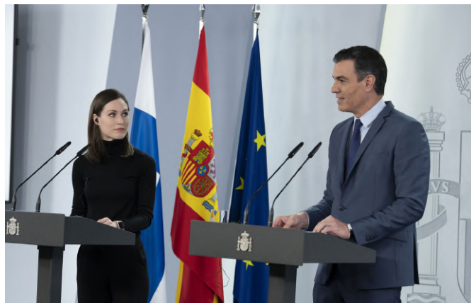
El presidente del Gobierno, Pedro Sánchez, se reúne con la primera ministra de la República de Finlandia, Sanna Marin, a quien ha recibido en La Moncloa. La Moncloa, Madrid 26.1.2022

El 4 de abril de 2023 Finlandia culminó su adhesión como miembro de pleno derecho de la Alianza Atlántica, en un proceso iniciado en mayo de 2022 y que obtuvo un apoyo abrumador del Parlamento con 188 votos a favor y 8 en contra. Así Finlandia se configura como el trigésimo primer miembro de la OTAN, organización con la que ya cooperaba de manera muy estrecha como "Enhanced Opportunity Partner". En el pasado Finlandia ha participado en distinta medida en las operaciones de la OTAN en Kosovo, Bosnia, Afganistán e Irak.