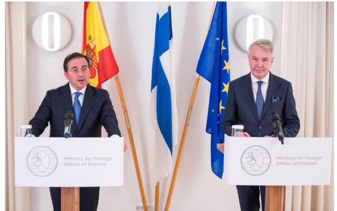
El ministro español del MAEUC, Albares junto a su homólogo finlandés Haavisto.-Helsinki 27/04/2022.-foto: MAUC.