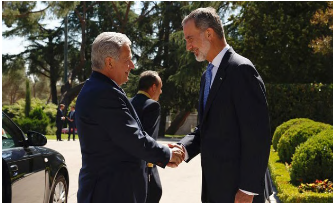
Su Majestad el Rey recibe el saludo del presidente de la República de Finlandia, Sauli Vainämö Niinistö, a su llegada al palacio de la zarzuela.-29/06/2022.

Los turistas españoles, por otra parte, muestran cada vez mayor interés por los viajes a Finlandia. El crecimiento de la demanda española de viajes a Laponia ha propiciado la apertura de un vuelo directo Madrid-Rovaniemi inaugurado en diciembre de 2023.