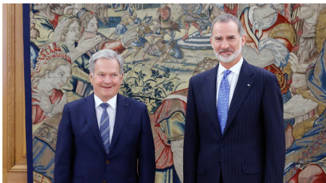
Su Majestad el Rey junto al Presidente de la República de Finlandia, Sauli Vainämö Niinistö. Palacio de La Zarzuela. Madrid, 29.06.2022.

merciales se han reducido al mínimo y, desde noviembre de 2023, se ha decretado el cierre temporal de la frontera oriental excepto para el tráfico de mercancías.