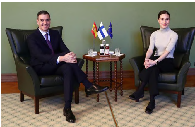
El presidente del Gobierno, Pedro Sánchez, mantiene un encuentro con la primera ministra de la República de Finlandia, Sanna Marin, en Säätytalo (Casa de los Estados), en Helsinki. 3.3.2023