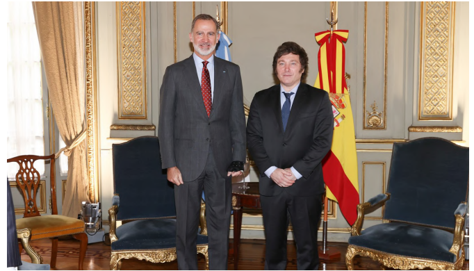
El rey de España Felipe VI junto al presidente de Argentina Javier Milei.-Buenos Aires (Argentina) 9/10/12/2023.-foto: Casa Real

Los flujos de inversión bruta de Argentina en España han sido más modestos, excepto en 2020 que fueron superiores con 301 M€ (+87% con respecto al año anterior) y en 2021, en que resultaron prácticamente iguales con 211 M€ (-29,9%); en 2022 volvieron a ser bastante inferiores con 51 M€ (-75,8%). En 2023 fueron de 75,4 M€ (42,8%).