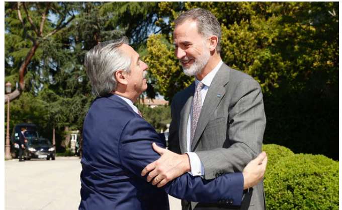
SM EL REY recibe el saludo del anterior presidente de Argentina, D. Alberto Fernández .-Madrid 5/10/2022 (Palacio de la Zarzuela).-foto: © Casa de S.M. el Rey.