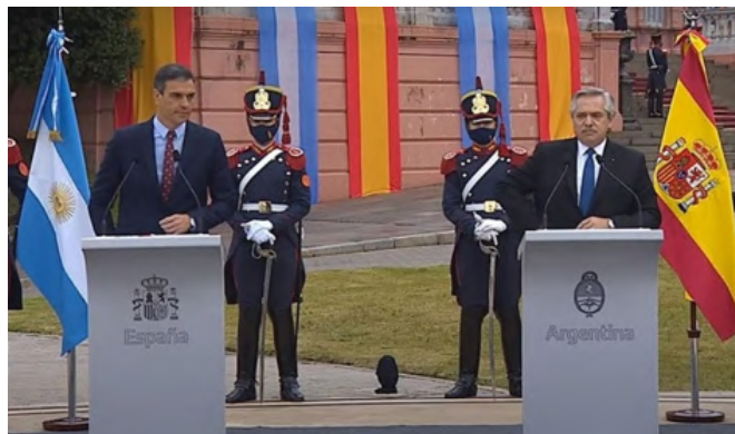
El anterior presidente de Argentina, Alberto Fernández recibe al presidente Pedro Sánchez en la Casa Rosada, con motivo del viaje a Latinoamérica.- Junio 2021.

Para contribuir al fortalecimiento institucional del Estado argentino, la AECID, a través de INTERCOONECTA, el Programa de Conocimiento e Innovación para el desarrollo en América Latina y el Caribe, financia todos los años la participación de profesionales y personal técnico y directivo de las administraciones públicas argentinas en actividades formativas y laboratorios de innovación que son coorganizados con instituciones españolas y de la región.