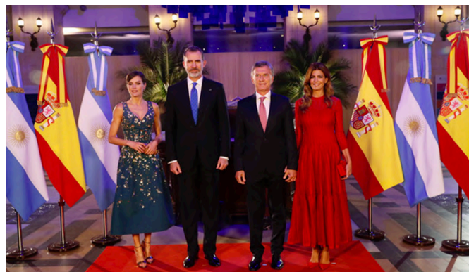
SSMM los Reyes junto a SE el anterior presidente y la primera dama de la República de Argentina.- Buenos Aires (Argentina), 24.03.2019 / 26.03.2019.

En particular, dentro de América Latina, para Argentina sigue siendo prioritario el impulso de Mercosur (en la que reviste particular importancia la relación con Brasil, su primer socio comercial).