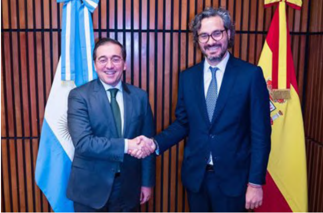
El ministro de Asuntos Exteriores, D. José Manuel Albares, y su anterior homólogo de Argentina, D. Santiago Cafiero. -Buenos Aires 26/10/2022.